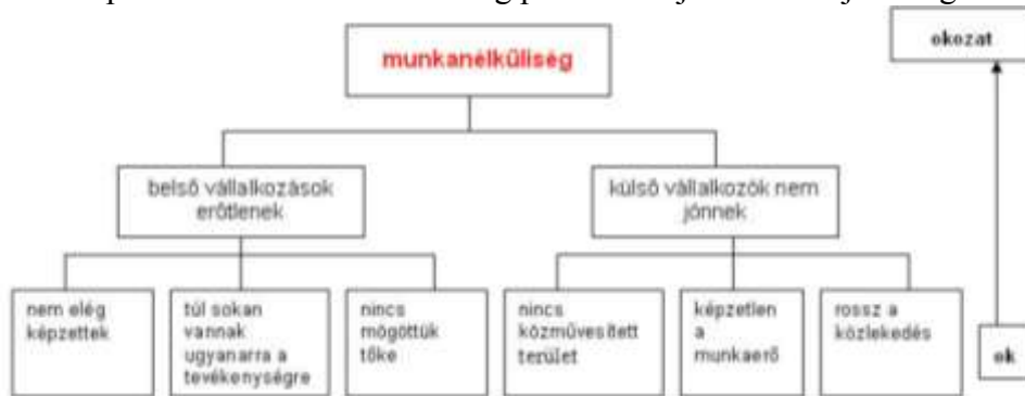
1. ábra Problémafa

A probléma elemzésénél elsőként megkeressük a problémák körét, majd elemezzük az ok-okozati összefüggéseket, végül mindezt egy problémafa szerkezettel ábrázoljuk. Minden feltárt problémát értékelni kell; ha az adott probléma ok, akkor az alsó szintre kerül. A következő ábrán példaként a munkanélküliség problémafáját tekinthetjük meg: