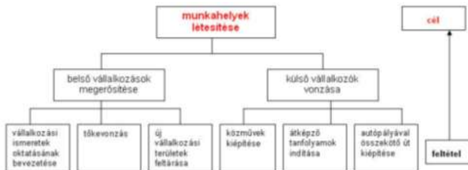
2. ábra Célfa

A problémafa valamely fennálló helyzet negatív aspektusait mutatja meg, míg a célok elemzése a kívánatos jövőbeni helyzet pozitív aspektusait. Ez magában foglalja a problémák célok formájában történő újrafogalmazását, tehát az ún. „célfa” a problémafa tükörképe. Az ok és okozati viszonyt az eszközök és célok viszonya váltja fel. A hasonló területekhez kapcsolódó célok csoportosítva, közös név alatt szerepelnek. Nézzük meg az előző ábra célfa ábráját!